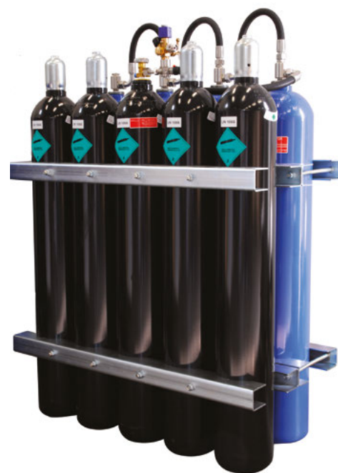
Acumuloare de ceață Ultra Fog

Sistemele de stingere a incendiilor Ultra Fog offshore și marine sunt concepute pentru a salva vieți și proprietăți. Prin urmare, este extrem de important ca sistemele să funcționeze eficient, cu un grad ridicat de fiabilitate. Obiectivul nostru este să proiectăm, să livrăm și să instalăm sisteme de cea mai înaltă calitate posibilă, cea mai bună funcționalitate posibilă și să oferim servicii care depășesc așteptările..