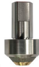
ULTRA FOG DUZĂ