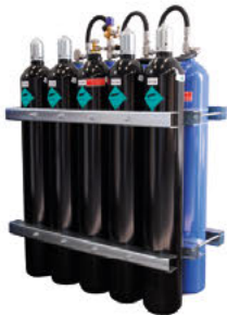
ULTRA FOG ACUMULATORI