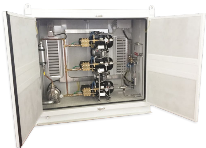
Unitate de micropompa și sistem MPU 335 cu o carcasă dedicată