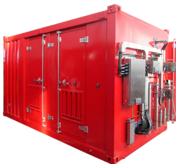
Carcasă container Ultra Fog pentru unități de acumulare în zone periculoase